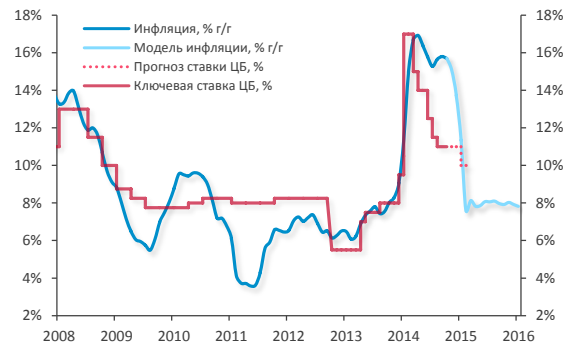
График 2. Ключевая ставка ЦБ РФ и темп инфляции.